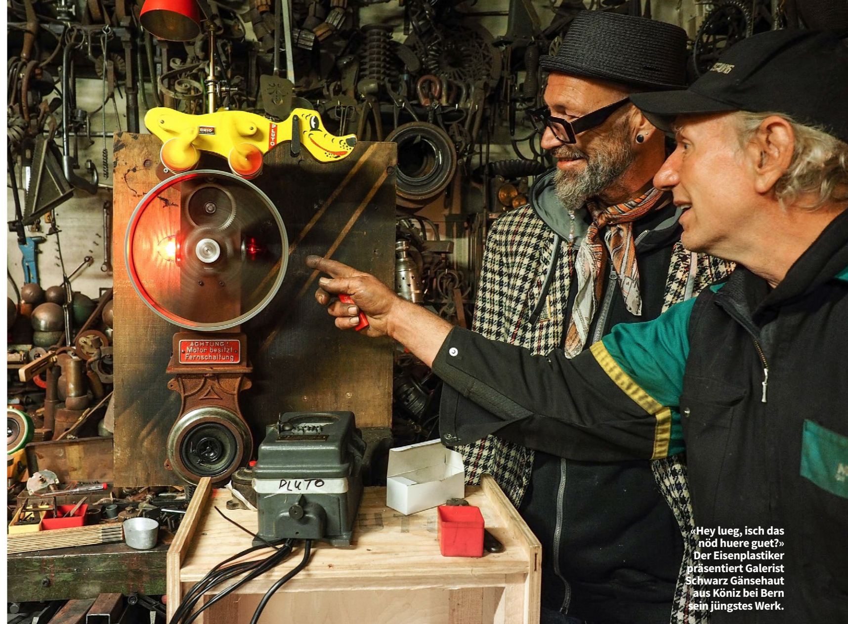
«Hey lueg, isch das nöd huere guet?» Der Eisenplastiker präsentiert Galerist Schwarz Gänsehaut aus Köniz bei Bern sein jüngstes Werk.

Der Prozess beginnt beim Material. «Ich sehe etwas und bin davon begeistert. Die Pläne reifen im Kopf, nicht auf Papier.» Schmid arbeitet immer an 20 Objekten gleichzeitig. Manchmal stehen