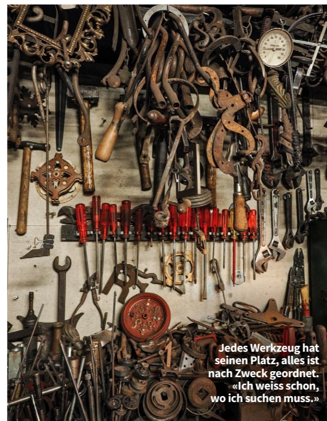
Jedes Werkzeug hat seinen Platz, alles ist nach Zweck geordnet. «Ich weiss schon, wo ich suchen muss.»