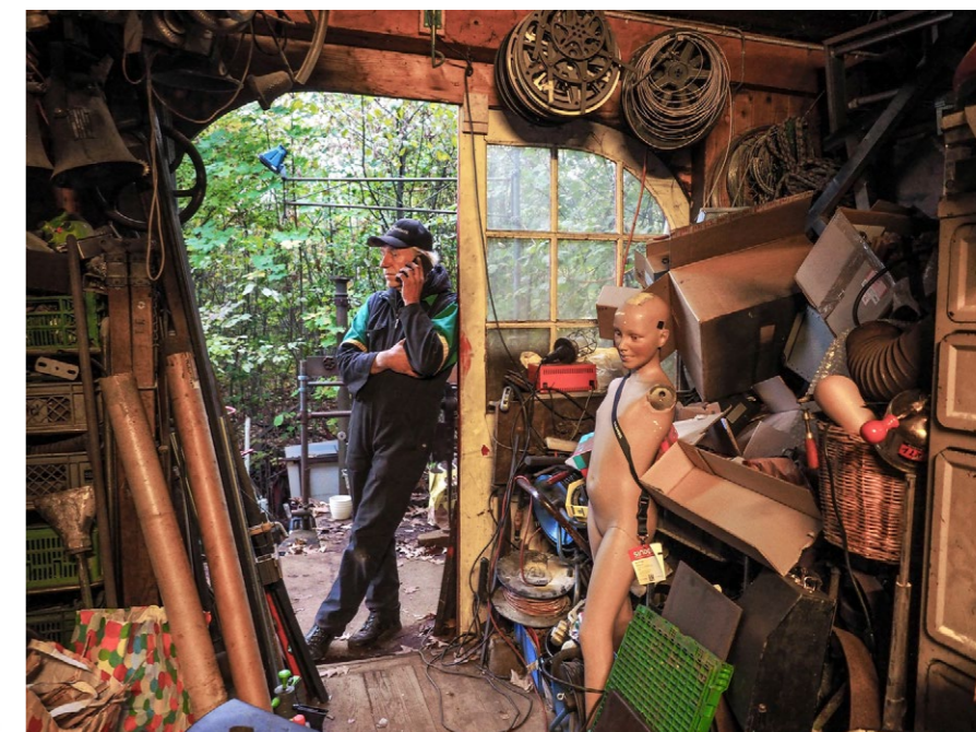
Der ehemalige Bühnenbildner findet seine Objekte und Trouvaillen etwa in Brockenhäusern. Fast alles lässt sich für seine ausgefallenen Kunstwerke wiederverwerten.